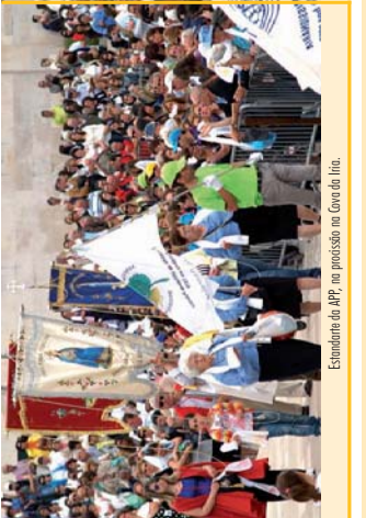
Estudante da APP, na peregrinação na Cova da Iria.

No regresso ao Norte do país, paramos, para nos medirmos nos merendeiros e era noite quando chegamos.