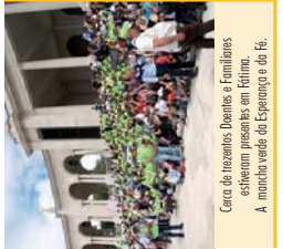
Cena de trezentos Doentes e Familiares, estiveram presentes em Fátima. A mancha verde da Esperança e da Fé.