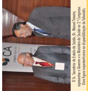
O Sr. Secretário de Estado da Saúde, Dr. Manuel Teixeira, representou o Governo e o Ministério da Saúde no 2.º Congresso. Uma figura importantíssima na disponibilização de Talamid.

A Associação Portuguesa de Paramiloidose, está muito honrada com a presença de V. Ex. Sr. Secretário de Estado da Saúde, Dr. Manuel Teixeira, com todos os indivíduos que formam esta mesa de honra e " todos " os presentes nesta magnífica sala do Teatro Municipal de Vila do Conde, quer agradecer ardentemente ao Governo Português, nomeadamente ao Ministério da Saúde, Dr. Paulo Macedo, Infarmed, Assembleia da República, Comissão da Saúde do Assenteble da República, Grupos Parlamentares e oblatamente os Senhores e Senhoras Deputados, os nossos Doentes e Familiares, Dirigentes Associativos, da Associação Portuguesa de Paramiloidose, a muitas personalidades e Portugueses em geral, que de uma maneira ou de