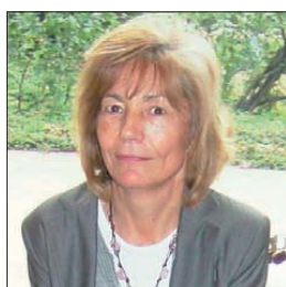
ENF.º SOLEDADE VENTURA NÚCLEO DE LISBOA