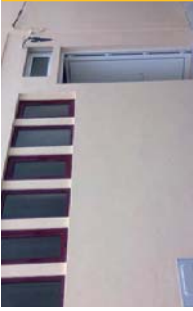
Fachada central do novo Sede do Núcleo, onde estão a ser executadas obras de melhoria...