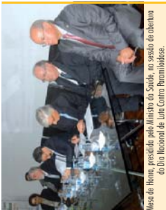
Mesa de Honra, presidida pelo Ministro da Saúde, no sessão de abertura do Dia Nacional de Luta Contra Paramiloidose.

Até à sua morte, no dia 16 de Junho de 2005, aos 99 anos este Grande Homem, Médico e Cientista, dedicou a sua vida em prol dos doentes paramiloidóticos. Tendo que vender o património para que nada faltasse aos nossos doentes de internados.