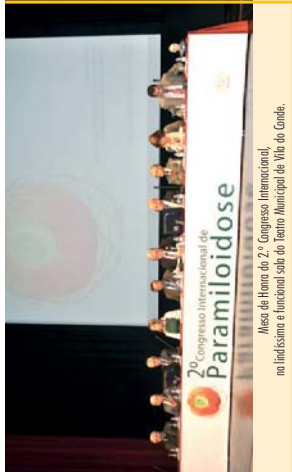
Mesa de Honra do 2.º Congresso Internacional na Universidade Nacional de Vila do Conde.