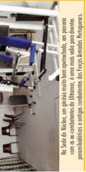
Na Sede do Núcleo, um grande trabalho desenvolvido...