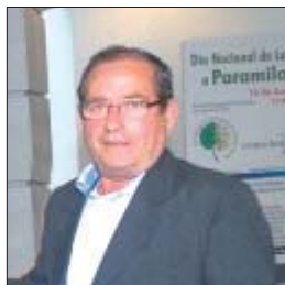
JOÃO DE DEUS NÚCLEO DE BARCELOS